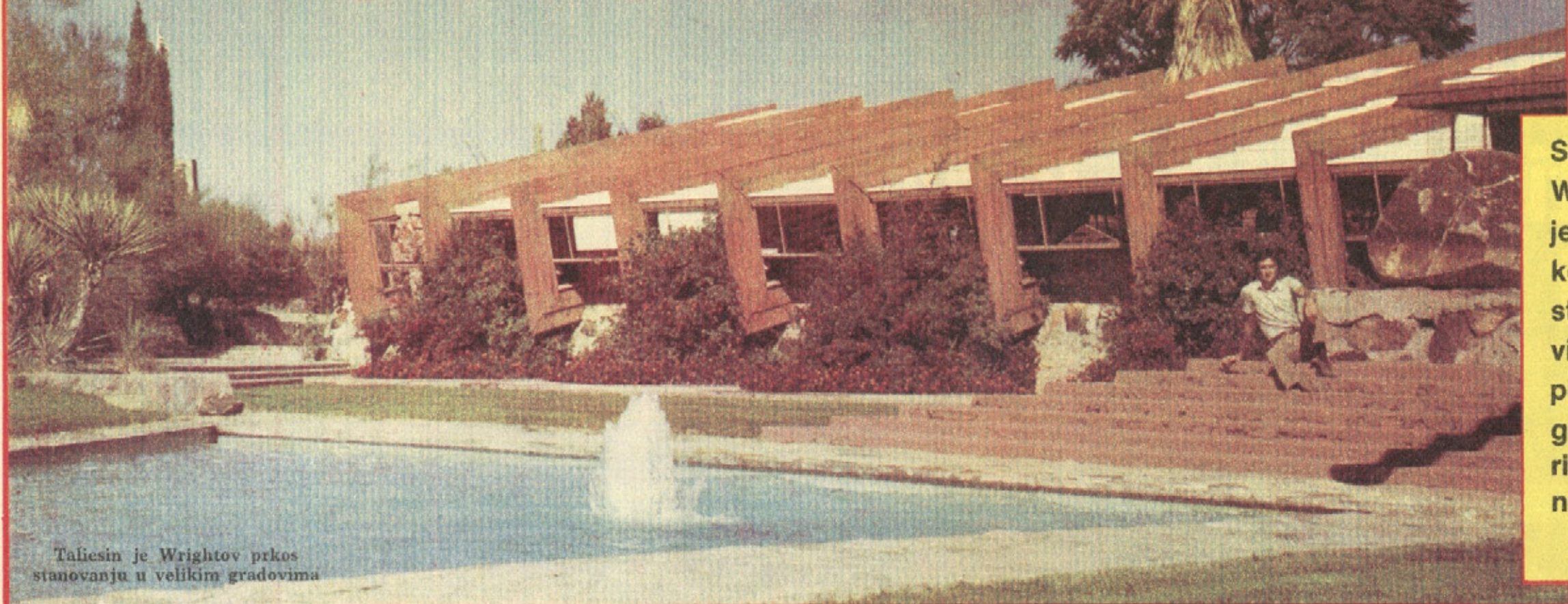
Taliesin je Wrightov prkos stanovanju u velikim gradovima

NAS SURADNIK U ŠKOLI NAJVEĆEG ARHITEKTA DANASNJICE, POKOJNOGA FRANKA LLOYDA WRIGHTA